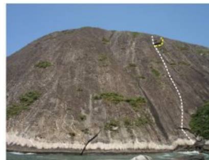
A descida é feita pela trilha para Itacoatiara

A proteção pode ser melhorada com Micro Friend (#0)